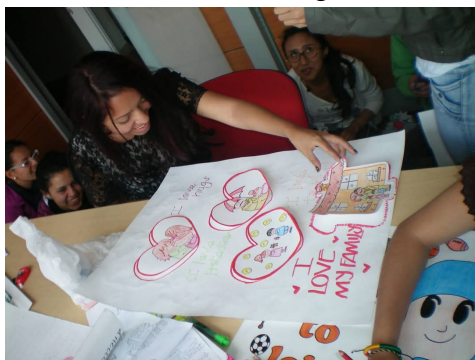
Figura 2 Creación del Big Book

La creación de Big Books por parte de los estudiantes se convirtió en un espacio de libre expresión, que les permitió externalizar situaciones de abuso y vulneración de sus derechos, principalmente violencia física, irrespeto por la diversidad y baja tolerancia. Luego de la implementación de los Big Books como estrategia didáctica y la creación de cuentos e historias (figura 2), se observó cómo los estudiantes ganaron confianza en sí mismos y se empoderaron para enfrentar situaciones difíciles que habían vivido en sus vidas y fueron capaces de alzar su voz. Sin embargo, los participantes adquirieron conciencia no solo de sus derechos sino también de las responsabilidades que tienen entre sí para promover y emprender acciones que favorezcan los Derechos del Niño, la dignidad y convivencia de los estudiantes.