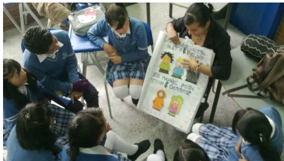
Figura 3 Socialización del Big Book

También es importante destacar que los estudiantes mostraron interés y compromiso por cambiar su propio contexto y realidad personal a través de la mejora de sus relaciones personales y del trato y comunicación en el aula (figura 3). De ahí la necesidad de abordar este tipo de temas al interior de la escuela con el fin de dar a conocer otras realidades relacionadas con los derechos de la niñez, por lo que el segundo reto será encontrar nuevas formas de acercar a los niños y niñas a la realidad de su contexto en función de hacer valer sus derechos, tarea tradicionalmente asumida con poca responsabilidad, sin responder a este mundo cambiante. La tendencia general está marcada por el registro de mucha información relacionada con el tema de los derechos de la niñez, pero en el ámbito real, falta su consolidación en proyectos concretos.