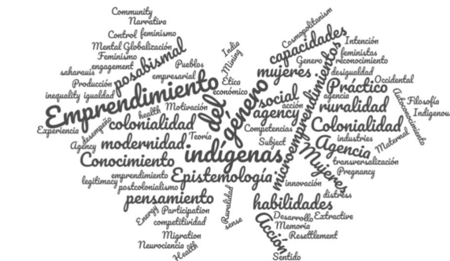
Figura 1 Representación de las 50 palabras (con más de cuatro letras) más utilizadas en los artículos analizados

En la última parte del estudio, se completó el análisis de contenido y se sistematizaron los 50 artículos, recurriendo al software Nvivo que evidenciaron interés sobre el tema de la participación mujer indígena en el emprendimiento rural (ver Figura 1). Se extrajo información resumida sobre el tema en términos del tipo de estudio, tipo de análisis, conclusiones, alcance y similitudes entre los estudios. Es decir, se realizó un análisis exploratorio del contenido de los diversos estudios a través de una representación de las palabras con más de cuatro letras que se mencionaron con mayor frecuencia en las palabras claves de estos artículos, obteniéndose inicialmente 148 palabras que se sintetizaron en la nube de palabras. De estas destacan 58 palabras como emprendimiento femenino, género, indígenas y colonialidad, íntimamente relacionadas con otras palabras de nivel secundario tales como comportamiento de ruralidad, acción, conocimiento, microemprendimientos, modernidad, habilidades, acción, pensamiento práctico y epistemología, lo que se demostrará más adelante en el artículo.