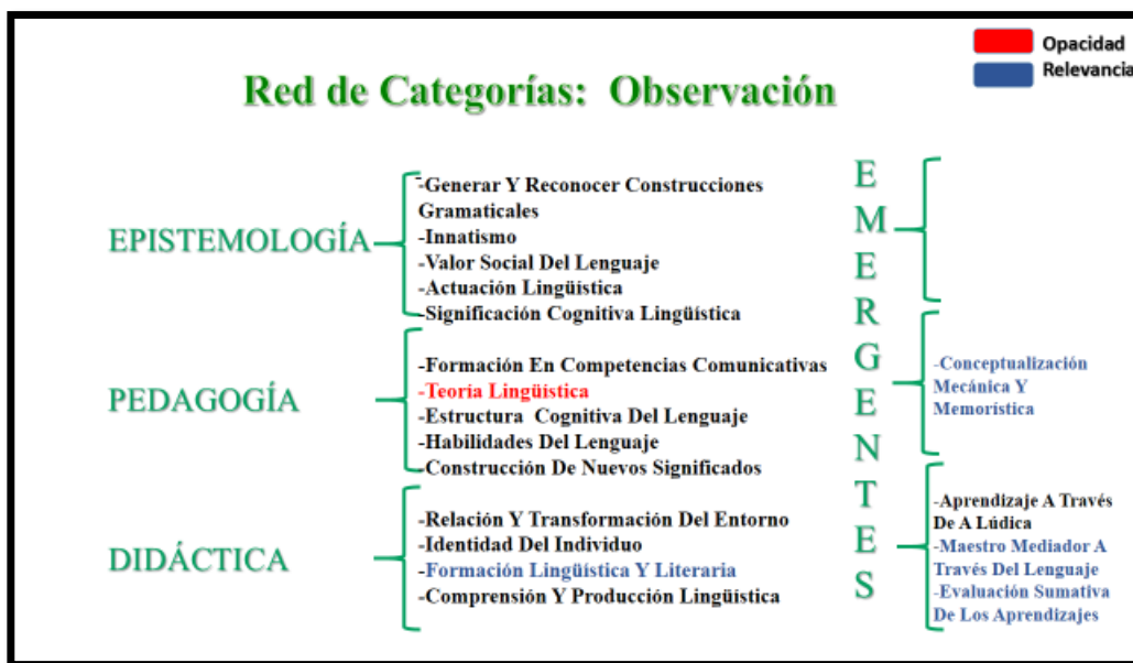
Figura 2 Red de categorías. Observación

A nivel general se representa la red de categorías de la observación y sus respectivas categorías emergentes (Ver Figura 2).