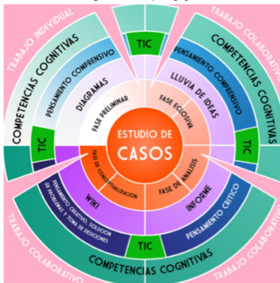
Fig. 1: Modelo pedagógico

La investigación se realizó a través de un conjunto de fases, descritas de la siguiente manera: