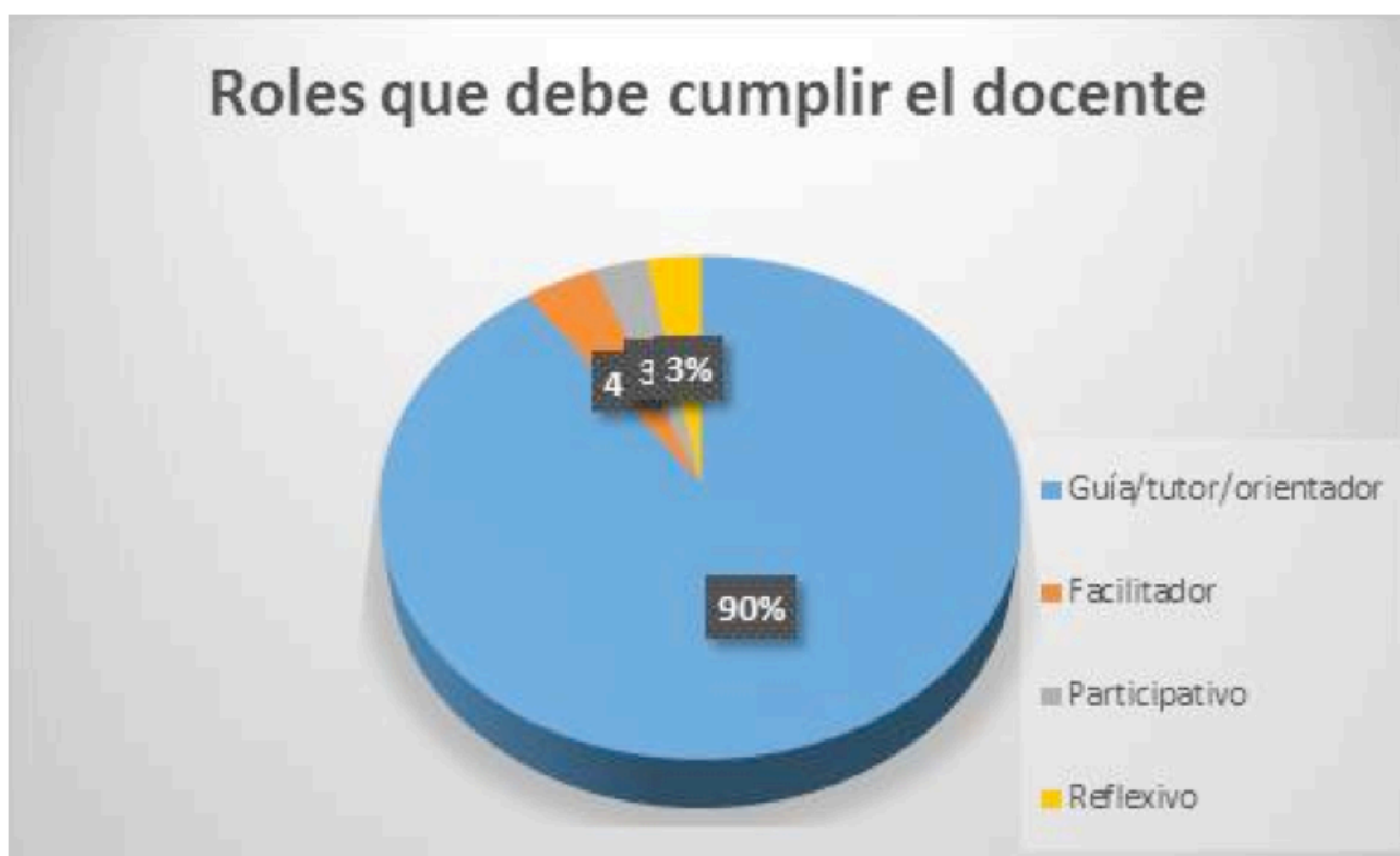
Gráfica No. 2-Roles que debe cumplir el docente.

En cuanto a la formación en los niveles profesional, especialista, magister y doctorado, los resultados de los docentes analizados se observan en la gráfica No.1; considerando el nivel de formación profesional una fortaleza, si se complementa con formación en pedagogía. Sin embargo en cuanto al dominio pedagógico el 12,2%, posee formación en esta área debido a sus conocimientos específicos en educación.