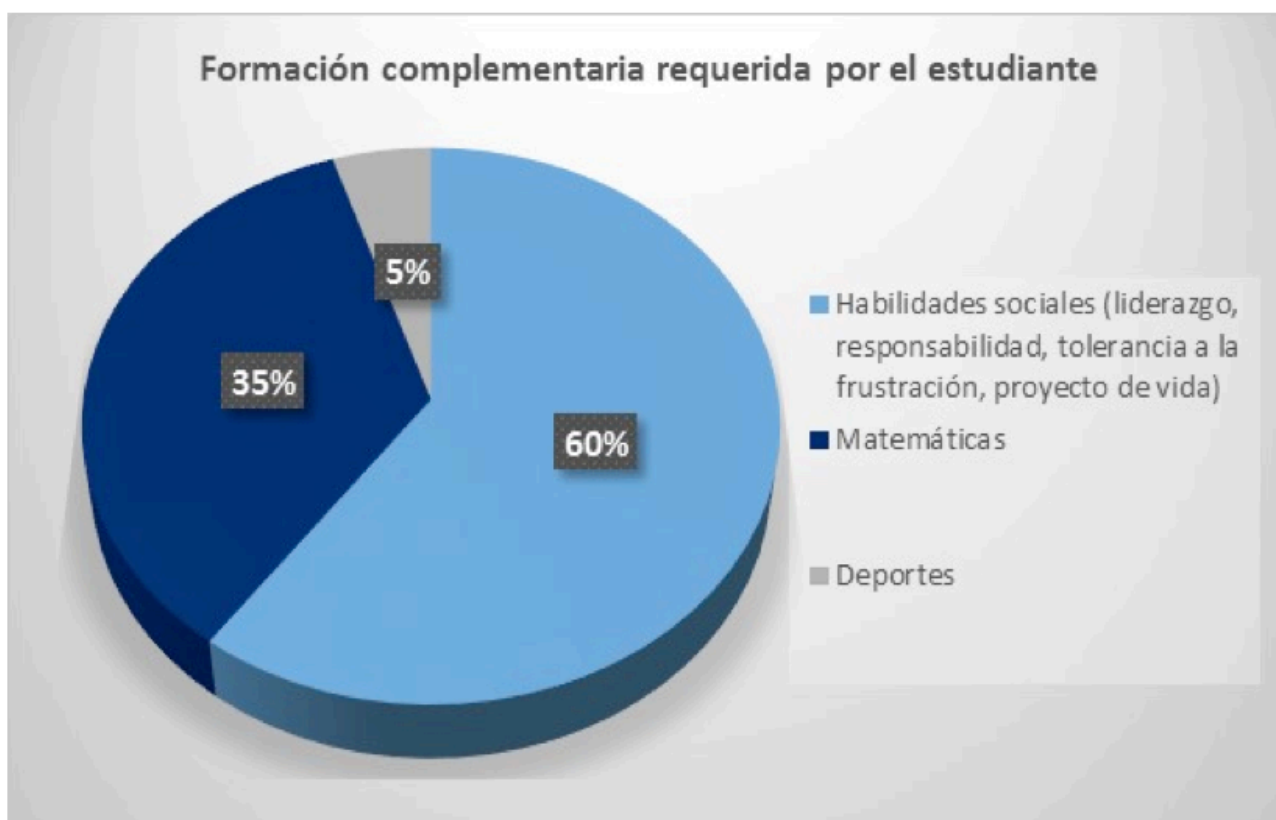
Gráfica No. 4 Formación complementaria requerida por el estudiante.

Primero que todo, y para hablar solo de los estudiantes es falso que la universidad no tenga el derecho ni los medios de ejercer sobre ellos una acción propia moral... Los hábitos que la escuela y el liceo apenas han podido desarrollar de una manera mecánica solo la universidad los puede hacer plenamente conscientes y reflexivos en cuanto lo permite el estado actual de la ciencia... Cuando el estudiante entra a la universidad, ya está comprometido con la mayor parte de los lazos que, al ligarlo a una cosa diferente de sí mismo, harán de él un ser moral. (Durkheim E. , 1990, pág. 110)