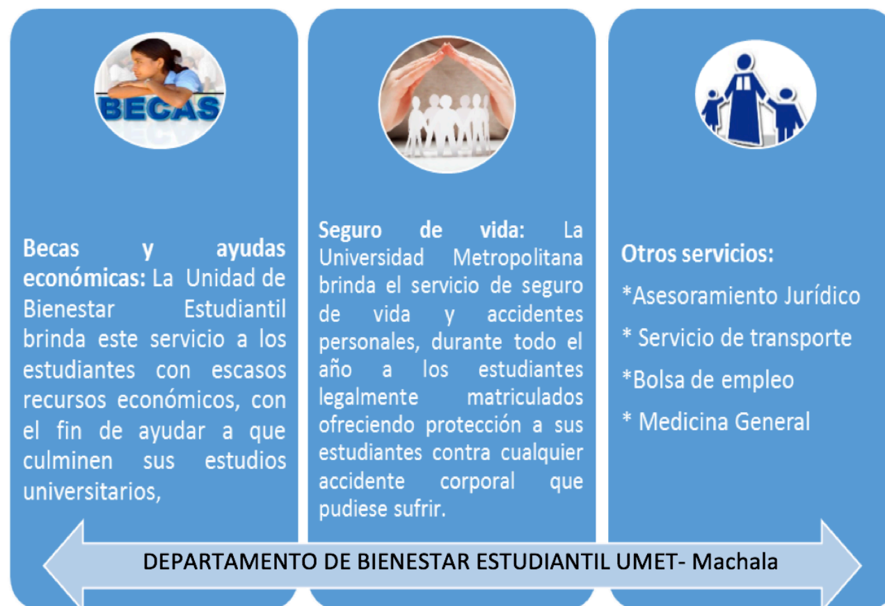
Gráfico 4. Programas y Servicios ofertados por Departamento Bienestar Estudiantil

Entre los principales servicios y programas brindados por el departamento o unidad de bienestar estudiantil mencionamos los siguientes de acuerdo a información proporcionada en la misma institución.