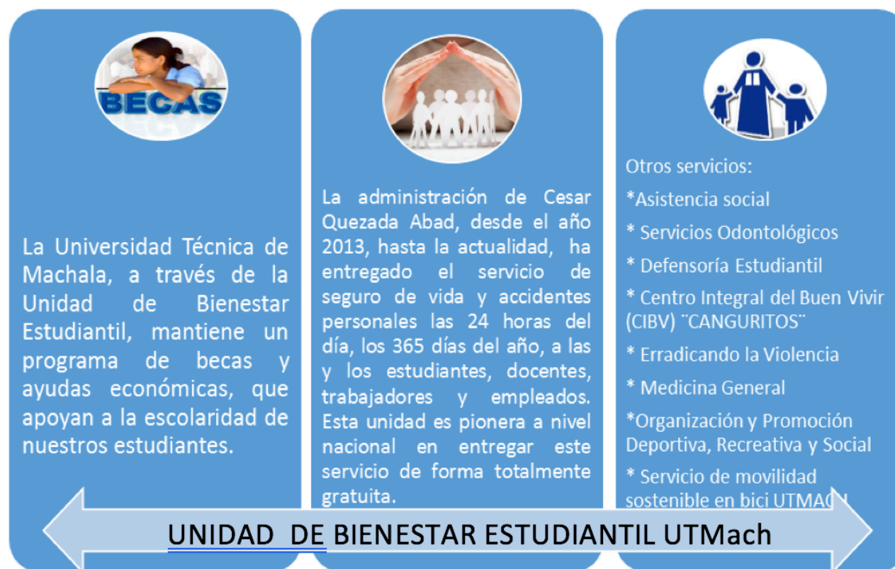
Gráfico 3. Programas y Servicios ofertados por Bienestar Estudiantil UTMach

Dentro de la cartera de programas y servicios que ofrece la Unidad de Bienestar Estudiantil de la Universidad Técnica de Machala encontramos los siguientes, los cuales se detallan en el grafico 3.