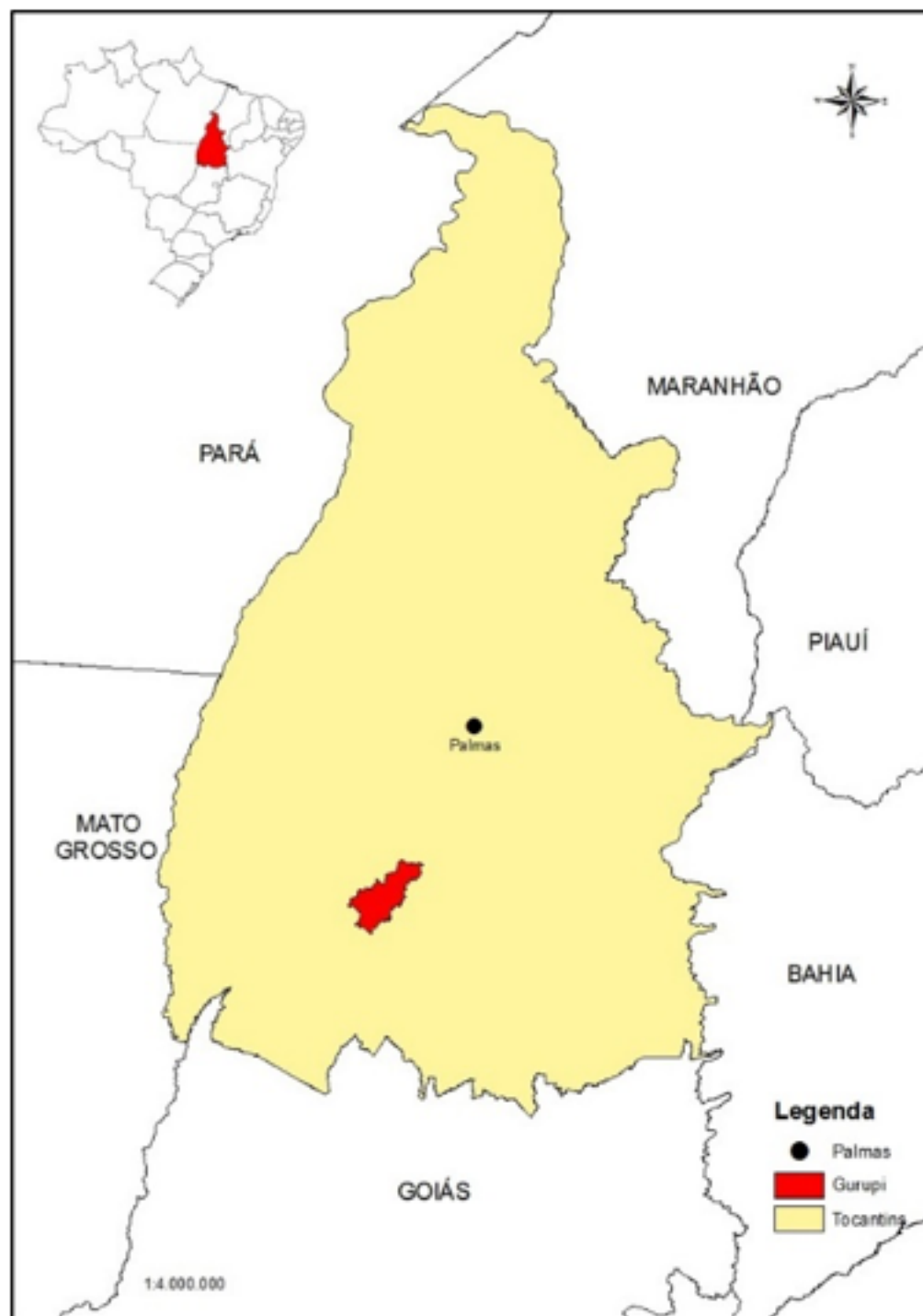
Imagem 1 – Localização da área de estudo

A precipitação média anual da região é de aproximadamente 1.500 mm, com destaque para os meses entre novembro e abril, quando ocorre a maior parte da precipitação. A temperatura média anual é de 26 °C, com temperaturas máximas variando de 33 a 36 °C, nas estações de primavera e verão; e mínimas de 21 °C, no outono e inverno (SANO et al., 2008). Inserido dentro do bioma Cerrado, o município apresenta diversas fitofisionomias campestres, savânicas e florestais, tais como: campo, campo cerrado, cerradão e formações de matas ciliares.